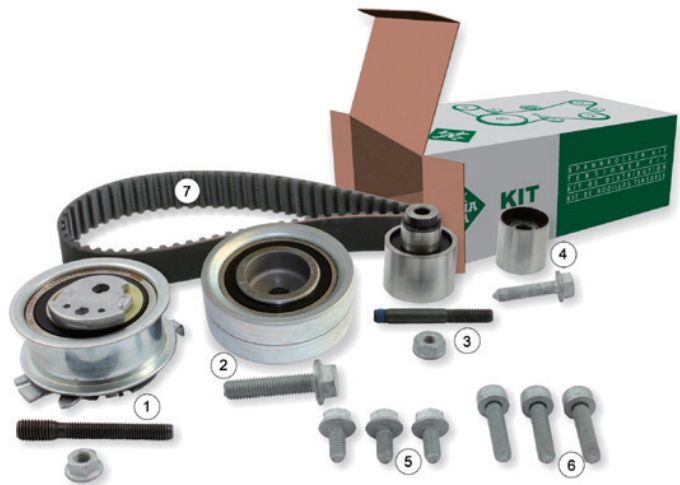
画像1：INA テンショナープーリーキット 530 0550 10

タイミングアセンブリのすべての部品は、同じサービス寿命を実現するように設計されており、受ける摩耗量も同じです。